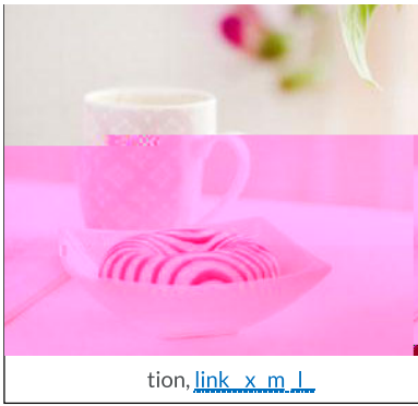
Im g Align L ft nd co y

c tion, which d scrib sth im ort nt cont nt dis l y d in th im g .